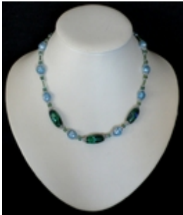
AC 080 Colliers simples Perles de Murano anciennes